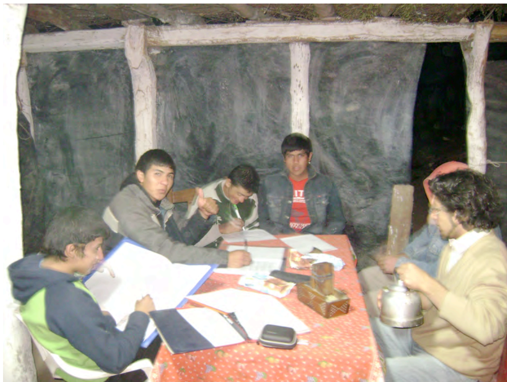
Fig. 2: Encuentro del taller, una noche de invierno de 2010, en la casa-rancho de uno de los jóvenes

Las notas de campo y los registros fílmicos evidencian que nunca realizaron lo que Broide (2009) denomina una modalidad literaria de lectura, sino otro tipo de proceso de lectura-corrección: lectura grupal silenciosa; comentarios murmurados; pequeñas acotaciones al oído; risas disimuladas; alternancias entre leer y enviar mensajes de texto; acotaciones onomatopéyicas en quichua que provocan risas; preguntas frecuentes hacia mí sobre cómo se escribe alguna palabra; una cabeza apoyada en el hombro de otro, mientras miran todos la notebook que uno sólo escribe; el teclear sumamente laborioso; los dedos apoyando la pantalla, siguiendo la línea de lectura; las bromas sobre alguna palabra, que disparaba una pequeña competencia en silencio, a ver quién sabía más, tomando el vocabulario como juez de esas pequeñas contiendas; dibujos circunstanciales referidos a elementos “rurales”, con los cuales se diseñó el libro; uso irrestricto del celular en simultáneo con el taller, para comunicar la “novedad” de que estaban en el taller, o “avisar” a algún amigo para que se “llegue” al punto de reunión. Consigno la descripción porque estas formas de lectura, de reunión, de escritura, no son situaciones habituales en los establecimientos educativos locales.