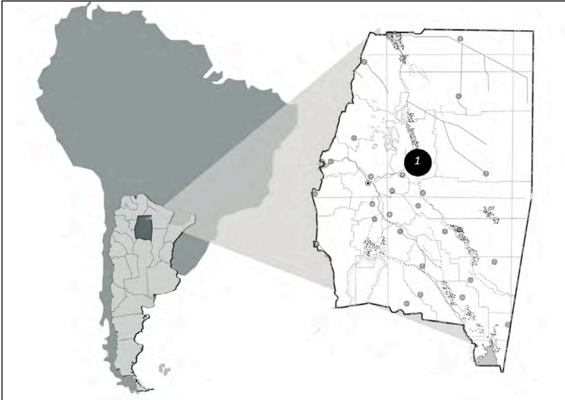
Fig. 2: Provincia de Santiago del Estero, dentro del mapa de Argentina.

la zona es poco productiva, con pequeñas parcelas de agricultura familiar, un bosque xerófilo adaptado al calor extremo y al suelo salitroso, pero también con numerosos conflictos de tierras con empresarios usurpadores, merced a nuevas obras hídricas que permiten nuevas y violentas “expansiones” de la frontera agropecuaria.